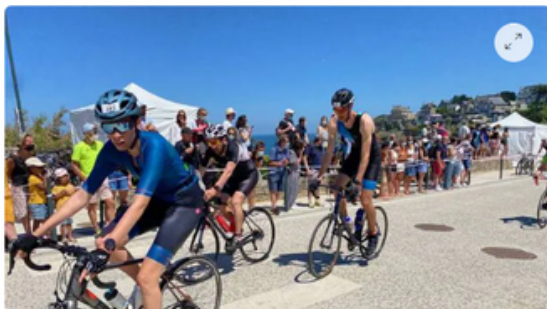
Les Triathlons de Saint-Malo auront lieu le dimanche 11 juin.

Depuis leur création en 2021, les triathlons de Saint-Malo sont installés, le deuxième week-end de juin, dans un calendrier de compétitions bien rempli en Bretagne. Pour cette 3 e édition, pas de changement de créneau, pas de changement de formats mais des modifications de parcours et l'engagement pris de respecter la charte des organisations édictée par la ligue de Bretagne de triathlon.