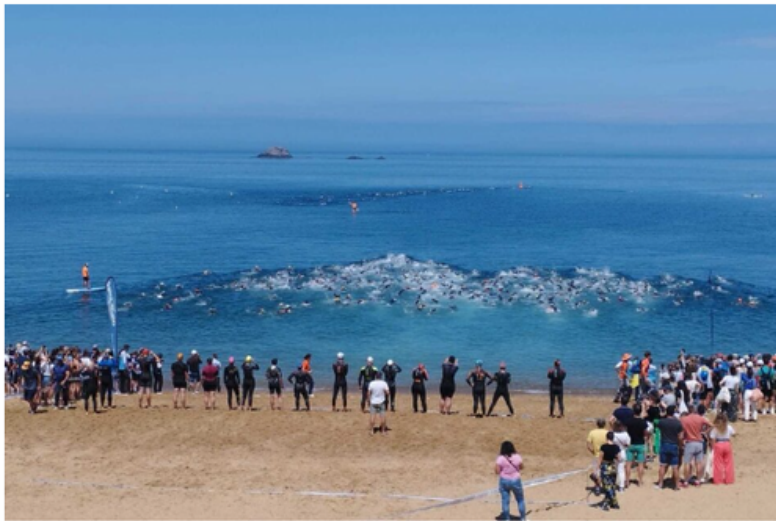
Les triathlètes se jetaient à l'eau de la plage du Val pour une boucle de 750 m.

Dimanche 11 juin, les Triathlons de Saint-Malo ont tenu leurs promesses : magnificence des parcours, compétitivité et applaudimètre à son plus haut niveau.