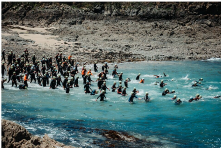
Près de 800 triathlètes, répartis sur des formats S et M, seront à Saint-Malo dimanche 11 juin 2023.

La 3e édition des triathlons de Saint-Malo, organisée par le Triathlon Côte d'Émeraude, se déroule ce dimanche 11 juin. 800 triathlètes sont attendus.