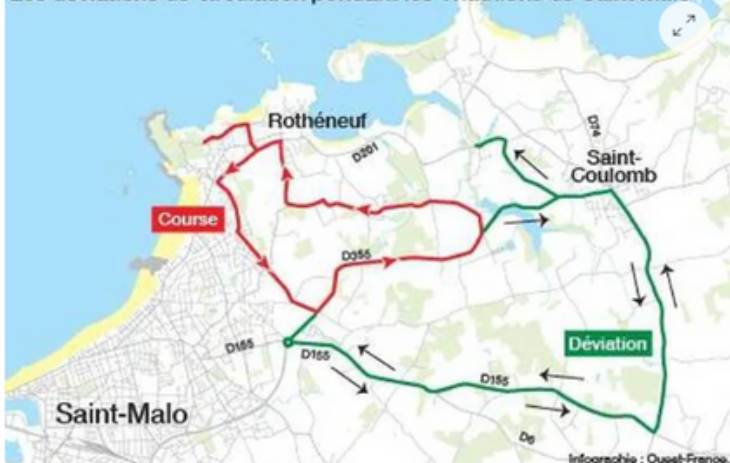
Les déviations de circulation des triathlons de Saint-Malo. | SERVICE INFOGRAPHIE OUEST-FRANCE