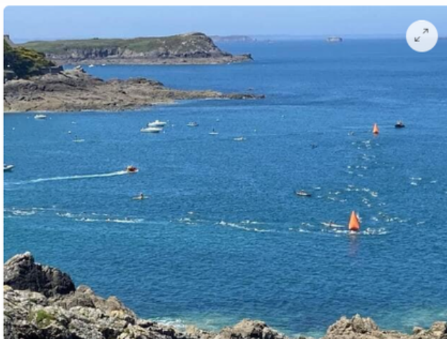
Les triathlons de Saint-Malo auront lieu le dimanche 11 juin.

Depuis leur création en 2021, les triathlons de Saint-Malo sont installés, le deuxième week-end de juin, dans un calendrier de compétitions bien rempli en Bretagne. Pour cette 3 e édition, pas de changement de créneau, pas de changement de formats mais des modifications de parcours et l'engagement pris de respecter la charte des organisations édictée par la ligue de Bretagne de triathlon.