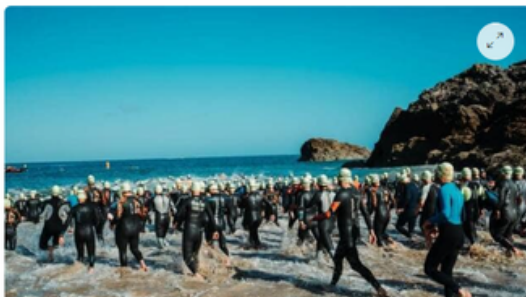
Ils seront près de 800 à s'élancer sur les deux épreuves des triathlons de Saint-Malo.

Les Triathlons de Saint-Malo (Ille-et-Vilaine), avec leurs deux épreuves, sont prévus dimanche 11 juin 2023. Près de 800 participants sont attendus.