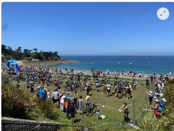
Les triathlons de Saint-Malo auront lieu le dimanche 11 juin.

Les organisateurs sont toujours à la recherche de bénévoles pour une partie ou toute la journée.